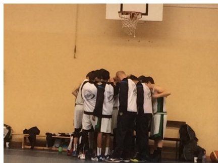
Qualification championnat de France UNSS excellence U15M - 2016